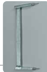
Staffe Suporte Brackets Étriers

Pour peinture au pistolet Distance mini entre les supports 500 mm Distance maxi entre les supports 3400 mm Poids 47 kg