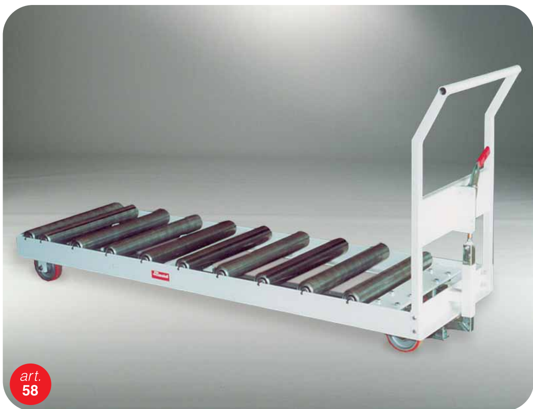
Carrello traslatore girevole Carro de translação giratório Revolving transfer trolley Chariot de translation pivotant