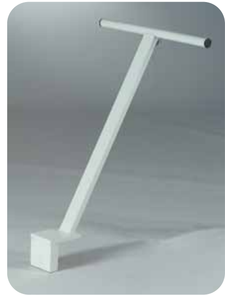
Manico Braço Handle Manche