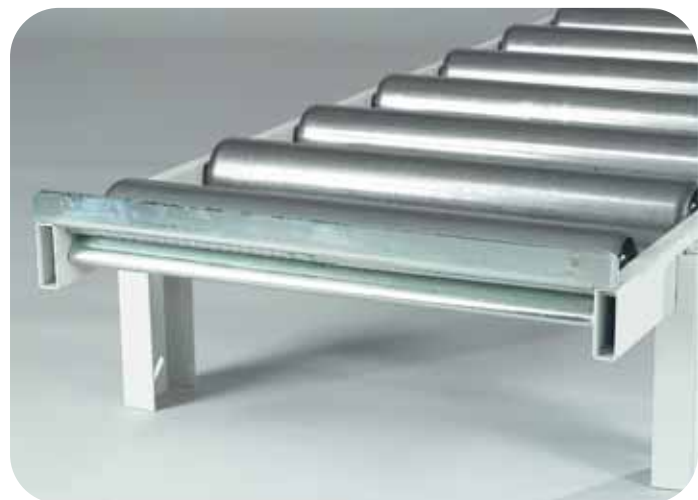
Battuta Via Rulli Batente basculante do transportador de roletes livre End stop line Butée du Chemin de Rouleaux